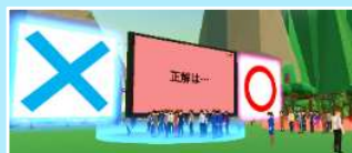
メタバース会場イメージ